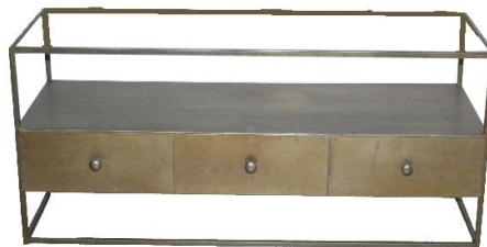
Frame 1 Pcs